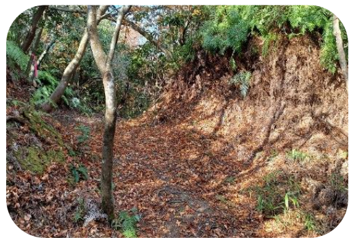
東虎口の枳形内から城外方向を見る

下段の西、北、東には、城外へ通じる虎口が開きます。特に東虎口は、高さ3mを超える土塁により完全な内枳形を形成します。大堀切とならぶ城跡最大の見どころであると同時に、中世の山城に新しい形式(織豊系城郭の特徴)の枳形虎口の存在は、大きな謎です。