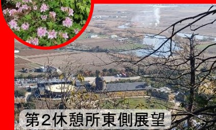
第2休憩所東側展望