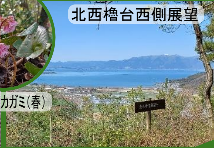
北西櫓台西側展望