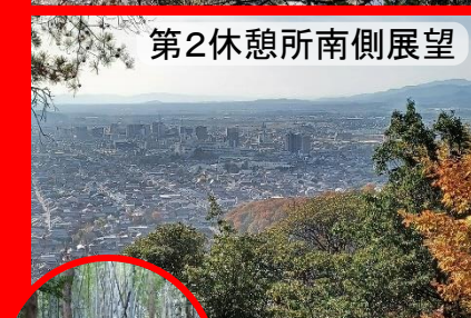
第2休憩所南側展望