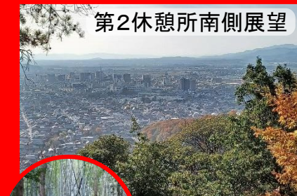
第2休憩所南側展望