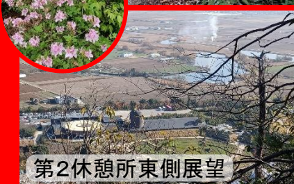
第2休憩所東側展望