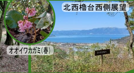
北西櫓台西側展望