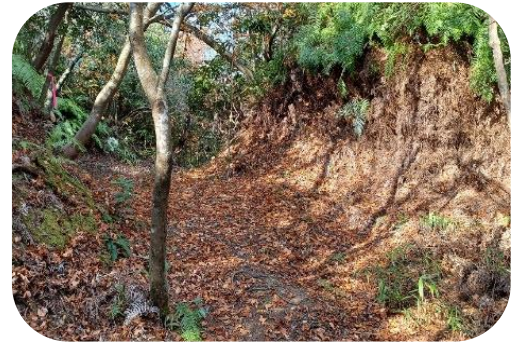
東虎口の枳形内から城外方向を見る

下段の西、北、東には、城外へ通じる虎口が開きます。特に東虎口は、高さ3mを超える土塁により完全な内枳形を形成します。大堀切とならぶ城跡最大の見どころであると同時に、中世の山城に新しい形式(織豊系城郭の特徴)の枳形虎口の存在は、大きな謎です。